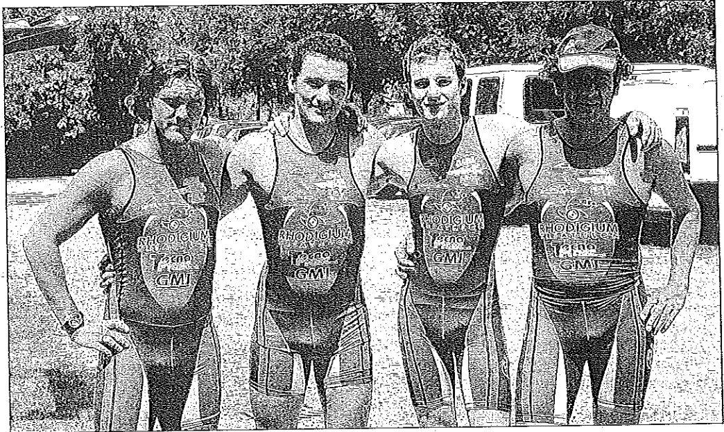
I triatleti della Rhodigium in gara ad Asola